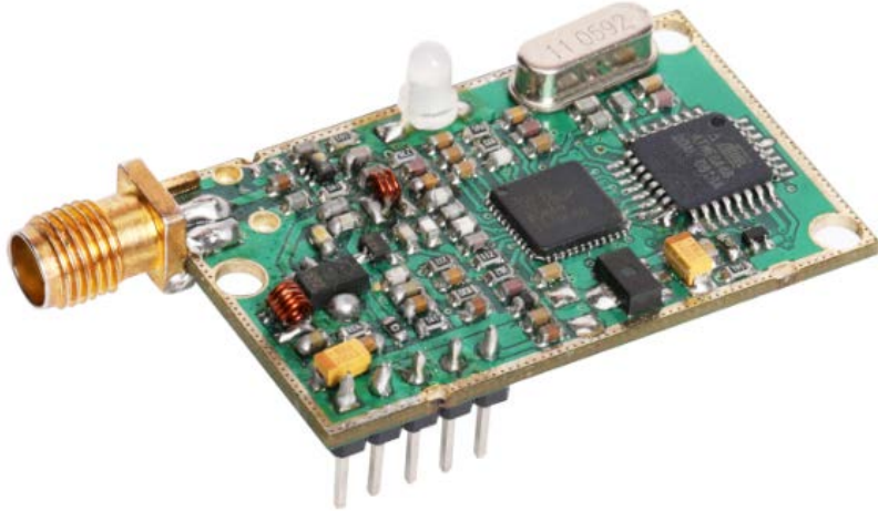
图一：BM500 远距离无线数传模块实物图